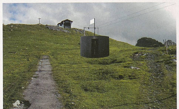
Bildmontage von Roman Signers «Windraum» auf der Ebenalp im Appenzell

Der Bildhauer und Sprengkünstler Roman Signer (67), gebürtiger Appenzeller und Wahl-St. Galler, ist Träger des Kulturpreises 2004 des Kantons St. Gallen. Signer ist international bekannt, seit er 1987 für eine Aufsehen erregende Schlussaktion an der Documenta 8 in Kassel sorgte. 1999 bespielte er den Schweizer Pavillon an der Biennale in Venedig.