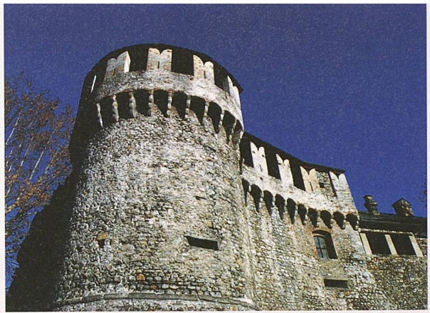
Bollwerk von Schloss Locarno: Wessen Handschrift trägt sein Entwurf?

Roger Kästle, BILDanstalt GmbH info@bildanstalt.com