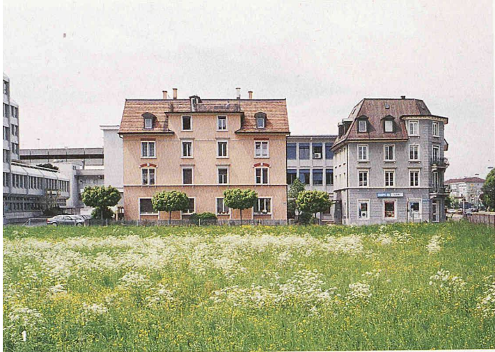
1, 2 und 4

Wie Bauten im Raum verteilt sind, ist entscheidend für die Belastung der Steuerzahler. Sie zahlen direkte Kosten für die Erschliessung mit Infrastruktur und indirekte, etwa für die Folgen von Mehrverkehr oder den Verlust von Landschaft (Bilder 1 und 2: Zürich, Georg Aerni; Bild 4: Kriens, Georg Aerni, aus dem Buch «Kriens für Zeitgenossen», Brunner Verlag, Kriens, 2003)