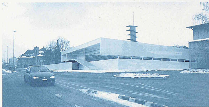
Die Eingangssituation mit der gedeckten Aussentreppe (1. Rang, GXM Architekten)

Vorschlag nach Meinung von Projektleiter Christian Stucki, weil er ein volumetrisch schönes Ensemble bildet. Um den Schlauchturm gruppieren sich die zwei bestehenden Bauten aus den 1960er-Jahren und die zwei neuen liegenden Volumen. Mit der umgebenden Mauer ist der Block auch schön abgeschlossen. Gleichzeitig rechnen die Veranstalter mit einer wirtschaftlichen Lösung.