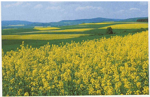
Raps mit Zukunft: Dank neuem Verfahren kann daraus kälteresistentes Schmieröl hergestellt werden

Auf www.wasserqualitaet.ch können die Trinkwasserdaten entweder nach Postleitzahl oder Wohnort abgerufen werden. Da die Beteiligung an dem Dienst fakultativ ist, sind noch nicht alle Wasserversorger eingetragen.