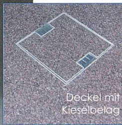
Deckel mit Kieselbelag