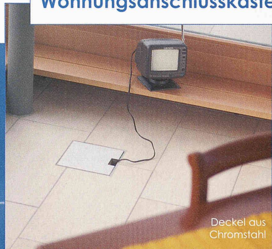
Deckel aus Chromstahl

Für eine optimale und flexible Erschliessung der Räumlichkeiten in Wohn- oder Gewerbe-Gebäuden. Einbetoniert im Unterlagsboden sind die Wohnungsanschlusskasten äusserst diskret und einfach nachrüstbar!