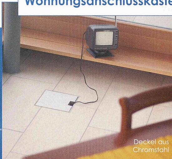
Deckel aus Chromstahl