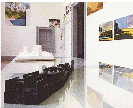
Blick in den Eingangsraum mit den Arbeiten von UNDEND