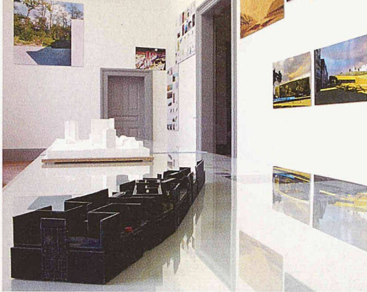
Blick in den Eingangsraum mit den Arbeiten von UNDEND