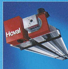
WeiRad. Die Strahlungsheizung für grosse Räume.

Sie integrieren sich unauffällig in Einkaufszentren und Messehallen. Sie beheizen gezielt Teilbereiche in Werkhallen. Sie sparen Energie durch Abbau der Temperaturschichtung. Sie fördern Produktivität mit idealen Arbeitsbedingungen. Die Hoval Hallenklima-Systeme schaffen den Sprung, auch wenn Sie die Messlatte hoch legen. Möchten Sie erfahren, weshalb Betreiber, Planer und Installateure in mehr als 25 Ländern auf Hoval Know-how vertrauen, wenn es um das Lüften, Heizen und Kühlen von Hallen geht? Dann verlangen Sie Unterlagen bei: Hoval Herzog AG, Lufttechnik, Postfach, 8706 Feldmeilen, Tel. 044 925 61 11, Fax 044 923 11 39, info@hoval.ch , www.hoval.ch .