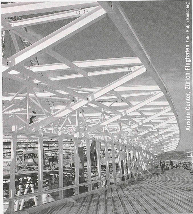
Airside Center, Zürich-Flughafen

Partner für anspruchsvolle Projekte in Stahl und Glas