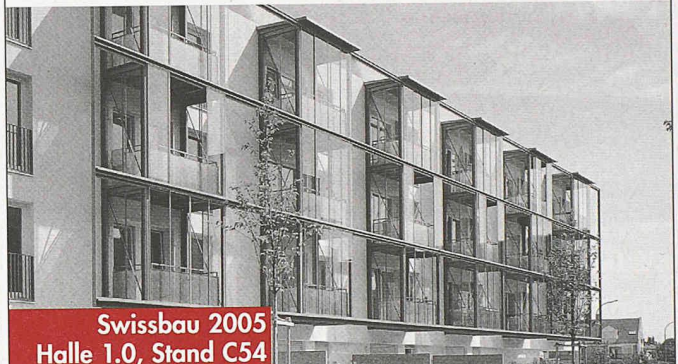
Swissbau 2005 Halle 1.0, Stand C54