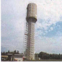
Behälter- und Bäderbau