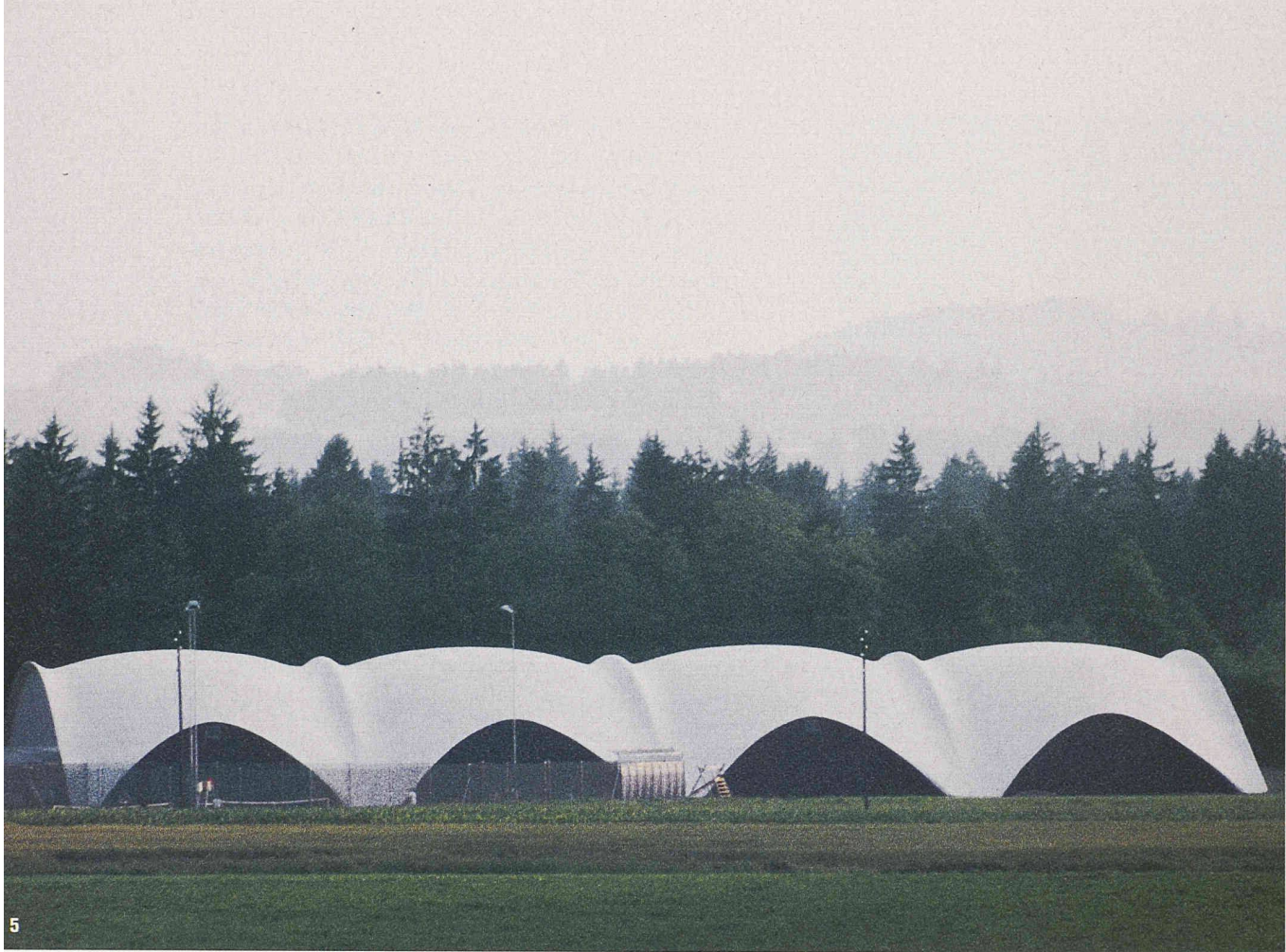
5 Tennishalle Heimberg (bei Thun), 1979, von Heinz Isler

George Washington Bridge, erstmals eine Distanz von mehr als 1000 m stützenfrei zu überspannen. Diese Hängebrücke über den Hudson River sollte den stark ansteigenden Automobilverkehr zwischen New Jersey und New York City bewältigen. Die feine Linie des an Drahtkabeln aufgehängten Fahrdecks verleiht dem Bauwerk eine grazile Leichtigkeit (Bild 3). Glücklicherweise wurde das Stahlskelett der Pylone nicht wie ursprünglich vorgesehen mit Natursteinen verkleidet. So kommt es in seiner konstruktiven Schönheit noch heute zur Geltung.