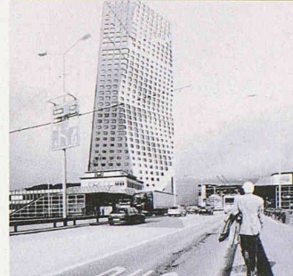
Sechseckiges Hochhaus als Skulptur (Josep Lluís Mateo)

Auf Voranmeldung geführte Gruppenbesuche auch ausserhalb der Öffnungszeiten (Telefon 01 278 76 85), www.maagarealplus.ch