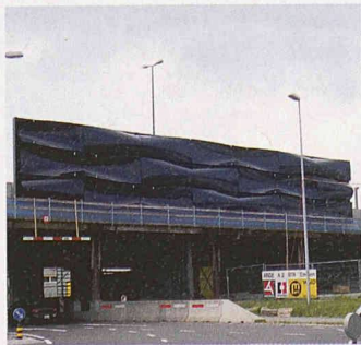
Verkleidete Lärmschutzwände bei Emmen

Gestaltet werden die Grüeblichachen-, die Seetal- und die Rüeggisingerbrücke, welche die A2 über lokale Verbindungsstrassen und -wege führen. Die Verkleidung wird nur von unten zu sehen sein; wer auf der A2 fährt, bemerkt davon nichts. Da die Lärmschutzwände im Siedlungsgebiet von Emmen zu einem dominanten Element werden, wurde laut Mitteilung schon in der Projektphase der Gesamtgestaltung grosse Sorgfalt entgegengebracht: Auf den zahlreichen Kunstbauten und den erhöhten, von weitem sichtbaren Dammlagen wirke die Bauweise leicht. Auf dem ganzen Abschnitt werden möglichst durchgehende Formen-, Farb- und Materialkonzepte angewendet, und die oberen Kanten der Wände erhalten einen ruhigen Verlauf.