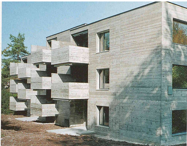
Wohnhaus Wasserschöpfli, 1968 (Bild: Galli & Rudolf Architekten)