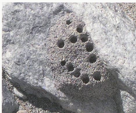
Nest der Mauerbiene: Die meisten der 20 hier vorkommenden Bienenarten hätten mit dem ursprünglichen Konzept ihre Lebensgrundlagen verloren

den Pfywald noch mehr beeinträchtigt. Der Widerstand verschiedener Naturschutzkreise bewirkte vorerst einen Planungsstopp. Erst 1980 legte der Kanton Wallis ein neues Konzept vor, das die Autobahn parallel zur Kantonsstrasse vorsah. Damals begannen die SBB im Zusammen-