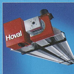
WeilRad. Die Strahlungsheizung für grosse Räume.

Sie integrieren sich unauffällig in Einkaufszentren und Messehallen. Sie beheizen gezielt Teilbereiche in Werkhallen. Sie sparen Energie durch Abbau der Temperaturschichtung. Sie fördern Produktivität mit idealen Arbeitsbedingungen. Die Hoval Hallenklima-Systeme schaffen den Sprung, auch wenn Sie die Messlatte hoch legen.