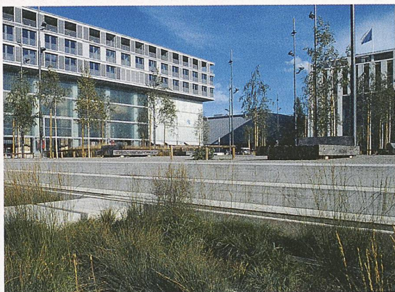
Richtiges Vorgehen vermeidet beim Bauen auf belasteten Standorten unliebsame Überraschungen