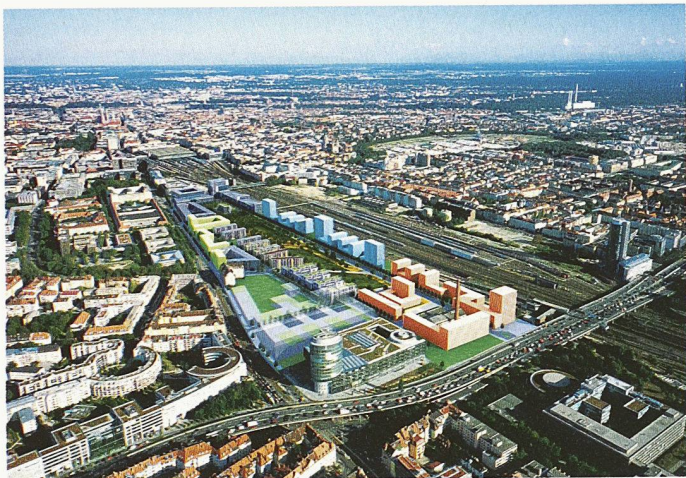
Luftbild-Montage Arnulfpark, München, Blick aus Nordwest. Beispiel für integrale Planung eines neuen Quartiers. Auf dem 18 ha grossen Areal nahe dem Münchner Hauptbahnhof entstehen 850 Wohnungen und 4300 Arbeitsplätze mit Versorgungs- und soziokulturellen Einrichtungen, guter Anbindung an den öffentlichen Verkehr sowie einem Park von 4 ha (Projekt: www.vivico.com / www.arnulfpark.de )