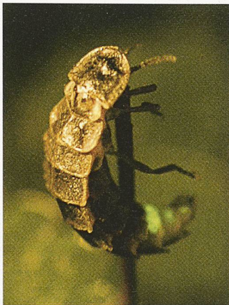
Weibliches Glühwürmchen