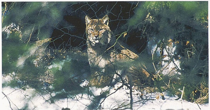
Luchsmännchen Turo

(ce) Am 17. Umweltforschungstag der Universität Zürich im Juni lag der Fokus auf dem Artenschutz. Die Berichte über die Wiedereinsiedlung von Bartgeier und Luchs zeigten deutlich die Probleme in der Schweiz: Flugunfähige Tiere wie der Luchs haben es massiv schwerer als Bartgeier, wieder Fuss zu fassen. Natürliche und künstliche Barrieren isolieren die sowieso schon kleinen Populationen – ein Überleben vieler Wildtiere in der Schweiz ist daher nur dann möglich, wenn sich die Tiere hindernisfrei bewegen können. Eindrücklich veranschaulicht hat diese Problematik das Beispiel des Luchsmännchens Turo, den man eingefangen und in die Ostschweiz umgesiedelt hat. Wieder frei, suchte er den Weg zurück in die Jura-berge, scheiterte aber an der Stadt Zürich. Dennoch zeigte das Tier keinesfalls Scheu, Parks und Gärten inmitten der Stadt zu benutzen. Dies beweist die potenzielle Wirksamkeit von städtischen Grünräumen als Vernetzungselement. Diese Grünräume so zu planen und zu bauen, dass sie als Verkehrsachsen für Tiere dienen können, würde auch uns Menschen erfreuen. Stellen Sie sich das Erlebnis vor, nach dem Kinobesuch am Bellevue noch rasch einen Luchs zu beobachten! Doch Vernetzungsvorhaben sind nur sinnvoll, wenn auch grössere naturnahe Gebiete an den jeweiligen Enden der Tier-Verkehrswege vorhanden sind. Neue Nationalpärke und Grossschutzgebiete braucht das Land, fordert folgerichtig Otto Sieber von Pro Natura, der damaligen Gründerorganisation