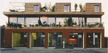
Gebaute Nachhaltigkeit: Umbau vom Bauern- zum Mehrfamilienhaus