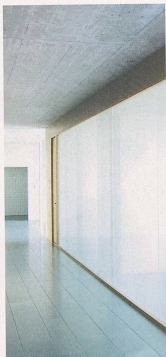
Erweiterung Schulanlage Merenschwand. Grundriss 1. Obergeschoss. Bilder: im Innern eines Gruppenraums und der Gang (Plan und Bilder: Furter Eppler Stirnimann Architekten)