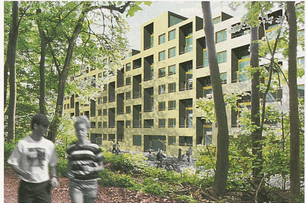
Der lang gestreckte Wohnriegel mit doppelgeschossigen Loggien liegt direkt am Wald (2. Rang, atelier 10:8)