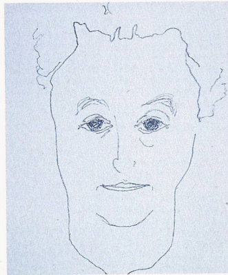
Aino Aalto auf einer Fotografie aus ihrer Studienzeit und auf einer Federzeichnung ihres Ehemannes Alvar Aalto von 1940