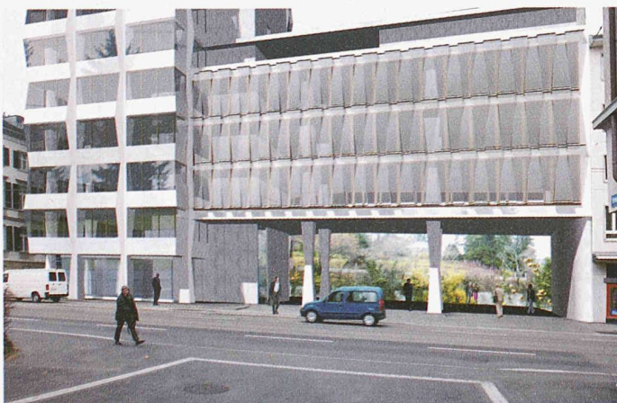
Der vorgesehene Neubau des Nebengebäudes Selnaustrasse 12 gibt den Durchblick zum Park des ehemaligen Botanischen Gartens frei

Ausgeschrieben war ein Studienauftrag für einen umfassenden, guten, architektonisch überzeugenden, auf Nachhaltigkeit ausgerichteten und ganzheitlichen Vorschlag. Das Hauptaugenmerk sollte auf den Fassaden, den Eingangspartien sowie den energetischen und technischen Einrichtungen liegen. Für den Studienauftrag konnten sich Planerteams mit mindestens einem Architekten, einem HLKS- und einem Bauingenieur, alle Mitglieder des SIA, und einem Bauphysiker mit Firmensitz in der Schweiz bewerben.