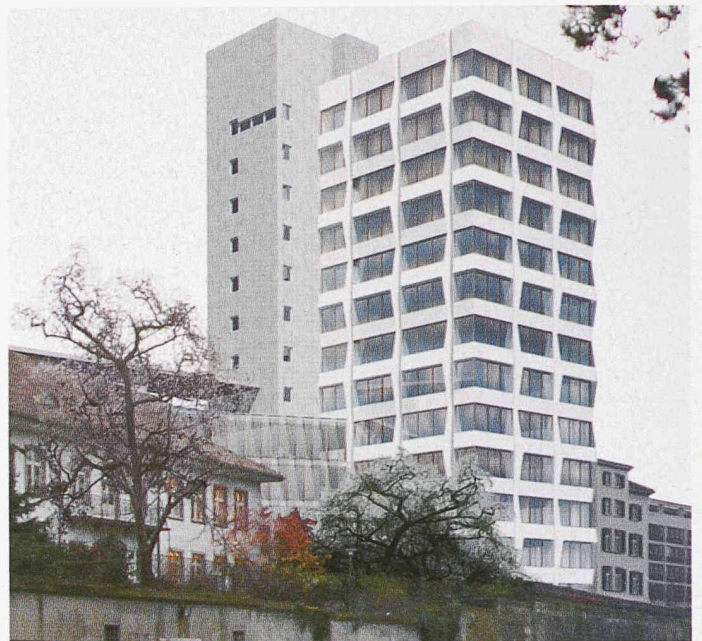
Das ausgewählte Projekt sieht für das SIA-Hochhaus eine plastisch gestaltete Fassade vor