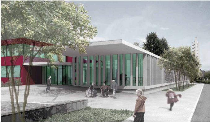
Mit einem neuen Längstrakt aus stehenden Betonelementen soll das Schulheim Rossfeld in Bern öffentlicher werden (1. Rang, Aebi & Vincent)