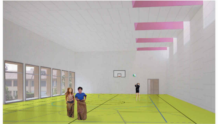
Neue und im Innern farbige Mehrzweckhalle für Dättlikon (1. Rang, Schneider & Gmür)