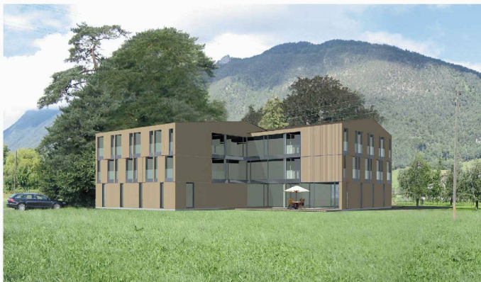
Der Neubau für das Wohnheim Höchenen übernimmt die bestehende winkelförmige Anlage (1. Rang, höing voney)