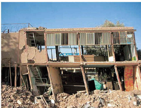
Ein bestehender Bau, der auf das Erdbeben wie ein Kartenhaus reagierte

René Guillod, Bauingenieur SIA, Basel, guillod@wgsp.com