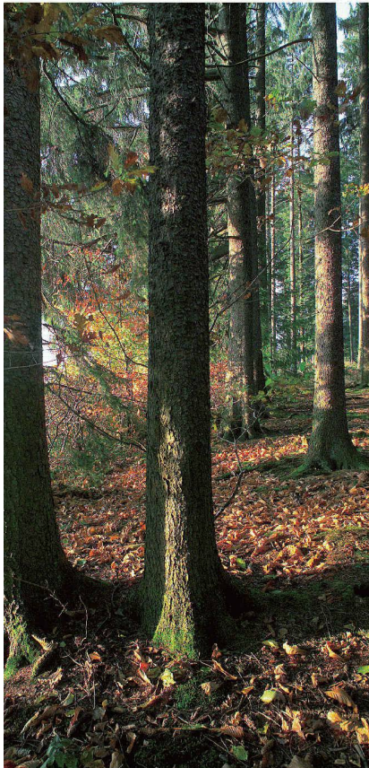
Rund die Hälfte des Schweizer Waldes ist heute FSC-zertifiziert