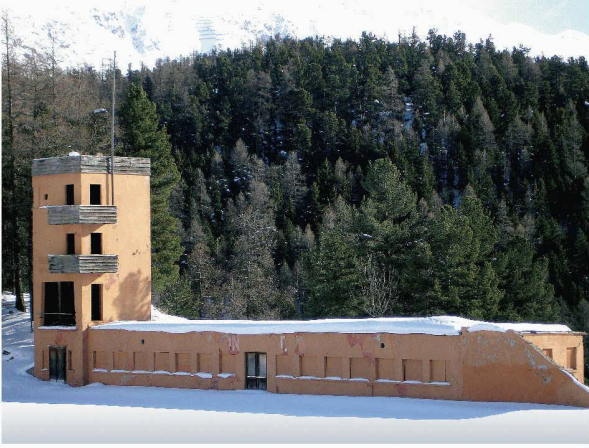
Heutiger Zustand des Olympiastadions