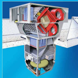
RoofVent® LHW. Das Dachlüftungsgerät mit Wärmerückgewinnung.