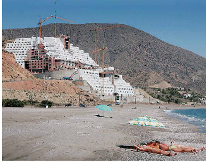
Das 22-geschossige Hotel «Azata del Sol» im Naturpark Cabo de Gata wird demnächst wieder abgerissen