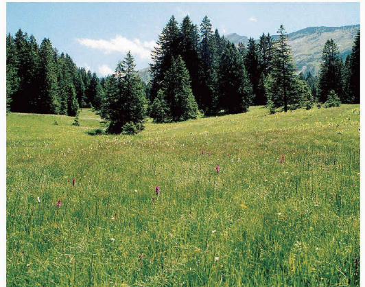
Bild oben: Auerhuhn-Lebensraum Beeriwald mit Leistchamm; Bild unten: Flachmoor. In Amden liegen zwei grosse Moorlandschaften und mit 111 ha auch das grösste Moorobjekt des Kantons St. Gallen