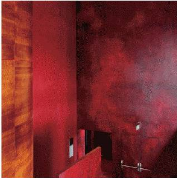
Jean Nouvel Kultur- und Kongresszentrum Luzern (KKL) Architekt: Jean Nouvel, Farbgestaltung: Otto Dürmüller