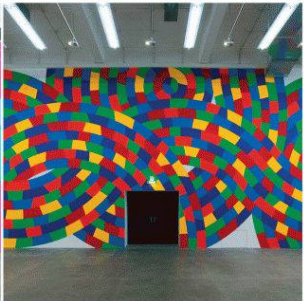
Sol LeWitt The Zurich Project, Haus Konstruktiv, Zürich Künstler: Sol LeWitt