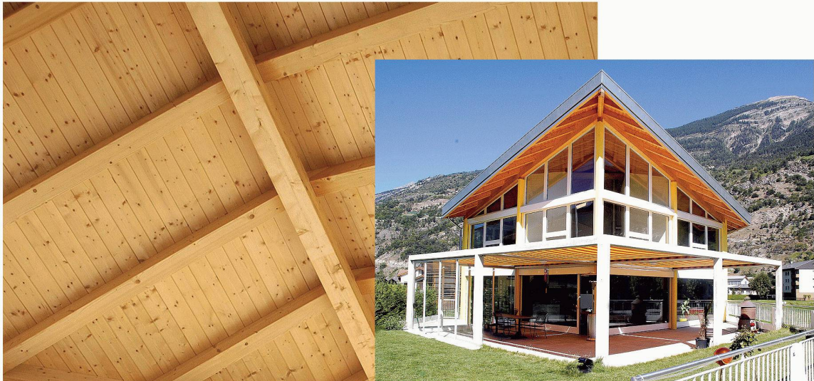
Baltschieder VS 2006