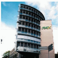
Gewerbe- und Wohnbau