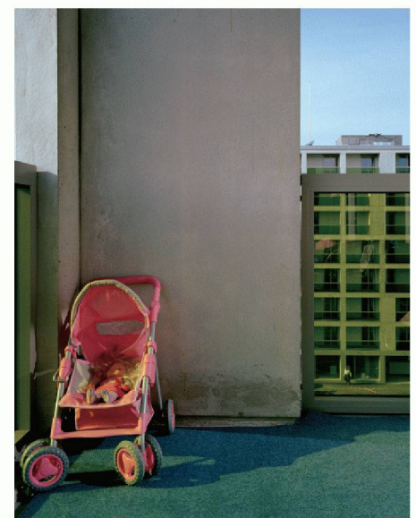
Ersatzneubau Wohnsiedlung Werdwies, Zürich

Sonn- und Feiertage geschlossen. Eintritt frei.