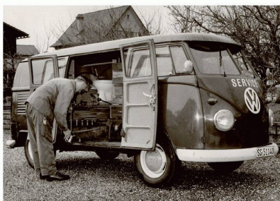
Zeitsprünge: Als dieses Sanitärservice-Auto zum Einsatz kam, war CHIC von Bodenschatz bereits 10-jährig

Im Jahre 1957 revolutionierte die Schweizer Firma Bodenschatz den Markt der Badezimmer-Accessoires auf nachhaltige Art und Weise. Die Produkte ihrer innovativen Accessoires-Serie – der legendären CHIC – waren die ersten, die indirekt – über einen Flansch – an der Wand befestigt wurden. Ein Kunststoffteil wird an der Wand angeschraubt, die Accessoires ganz einfach darüber geschoben. Dank dieser Erfindung waren und sind die Befestigungsschrauben nicht mehr sichtbar und der einmalige Siegeszug durch die Schweizer Badezimmer nahm seinen Lauf.