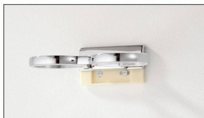
Der Flansch wird an der Wand befestigt, die Accessoires werden ganz einfach darüber geschoben.