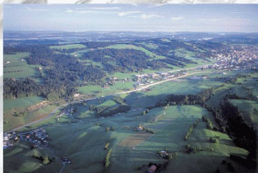
G. B. à la Guillaume

Die Neuenburger Städte Le Locle und La Chaux-de-Fonds schreiben zwei städtebauliche Wettbewerbe für die Gestaltung von zwei Örtlichkeiten aus. Es handelt sich um Le Crêt-du-Loche (zwischen den zwei Städten) und Le Col-des-Roches (nahe an der Grenze zu Frankreich). Die zwei Städte fördern eine Stadt- und Landschaftsplanung, die im Zeichen der Qualität und der nachhaltigen Entwicklung steht. Beide im Wettbewerb ausgeschriebenen Örtlichkeiten befinden sich entlang der Linie des TransRUN, ein im Rahmen der neuen Agglomerationspolitik entwickeltes Projekt einer regionalen S-Bahn zur Verbindung der höher gelegenen Region mit der tiefer gelegenen Region des Kantons. Die zwei Städte wurden vom Bund für die Liste des UNESCO-Weltkulturerbes vorgeschlagen. Dieses einzigartige Stadtensemble zeugt von ausserordentlicher Architektur und Geschichte der Uhrendindustrie.