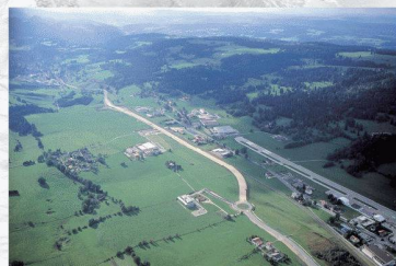
G. B. à la Guillaume