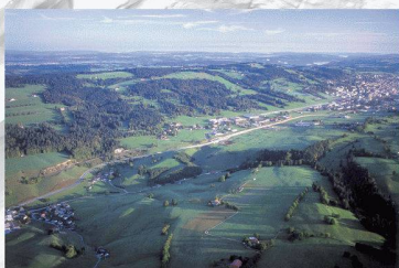
G. B. à la Guillaume

Die Neuenburger Städte Le Locle und La Chaux-de-Fonds schreiben zwei städtebauliche Wettbewerbe für die Gestaltung von zwei Örtlichkeiten aus. Es handelt sich um Le Crêt-du-Loche (zwischen den zwei Städten) und Le Col-des-Roches (nahe an der Grenze zu Frankreich). Die zwei Städte fördern eine Stadt- und Landschaftsplanung, die im Zeichen der Qualität und der nachhaltigen Entwicklung steht. Beide im Wettbewerb ausgeschriebenen Örtlichkeiten befinden sich entlang der Linie des TransRUN, ein im Rahmen der neuen Agglomerationspolitik entwickeltes Projekt einer regionalen S-Bahn zur Verbindung der höher gelegenen Region mit der tiefer gelegenen Region des Kantons. Die zwei Städte wurden vom Bund für die Liste des UNESCO-Weltkulturerbes vorgeschlagen. Dieses einzigartige Stadtensemble zeugt von ausserordentlicher Architektur und Geschichte der Uhrendindustrie.