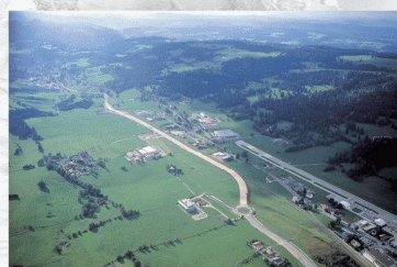
G. B. à la Guillaume