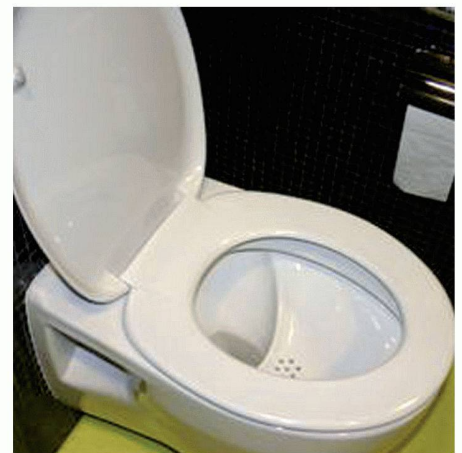
Im NoMix-WC wird im vorderen Teil der Schüssel der Urin abgetrennt

Weitere Informationen: www.novaquatis.ch