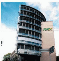
Gewerbe- und Wohnbau