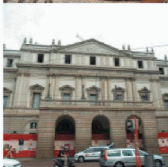
Neubauten in und an bestehenden Bauten

Durch die über 40-jährige Erfahrung und Spezialisierung auf vorbeugende und sanierende Abdichtung gegen drückendes Wasser, sowie ständige Weiterentwicklung der Produkte und Lösungen, können Sie mit RASCOR nur gewinnen.