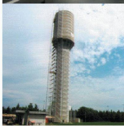
Behälter- und Bäderbau