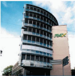
Gewerbe- und Wohnbau