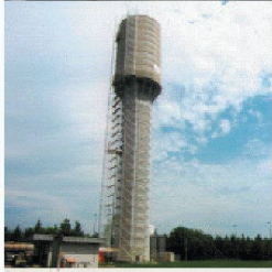
Behälter- und Bäderbau