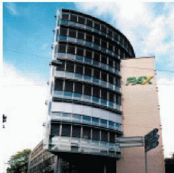
Gewerbe- und Wohnbau