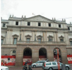
Neubauten in und an bestehenden Bauten

Durch die über 40-jährige Erfahrung und Spezialisierung auf vorbeugende und sanierende Abdichtung gegen drückendes Wasser, sowie ständige Weiterentwicklung der Produkte und Lösungen, können Sie mit RASCOR nur gewinnen.