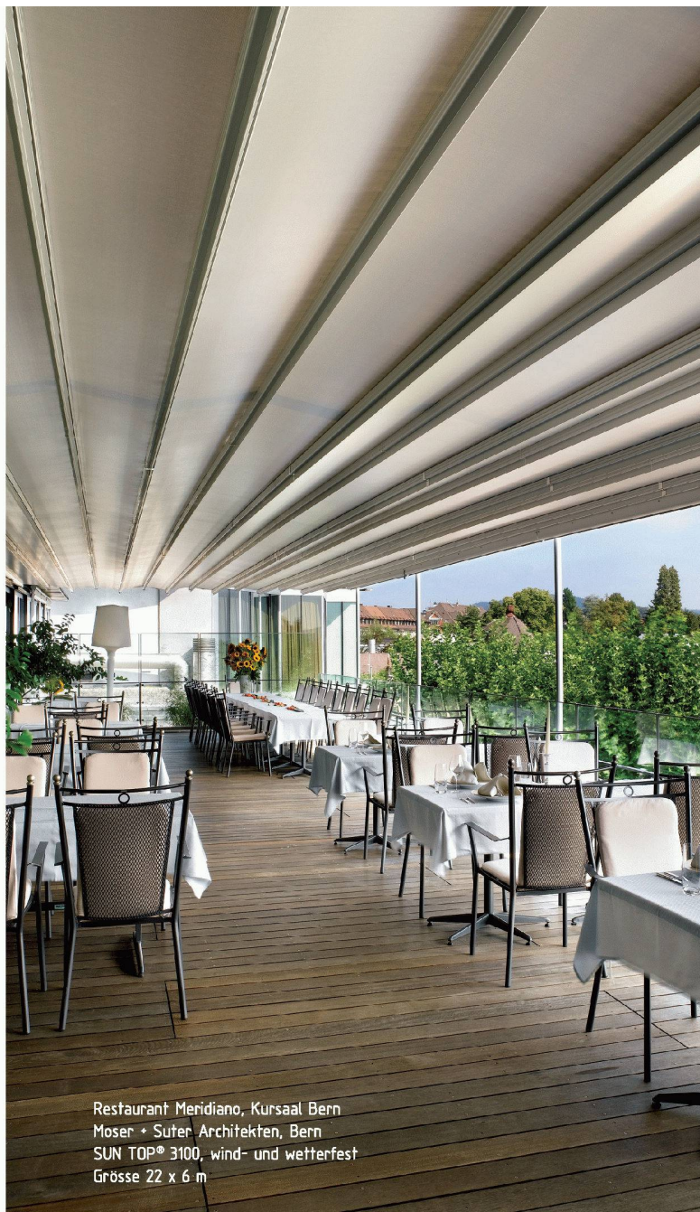
Restaurant Meridiano, Kursaal Bern Moser + Suter Architekten, Bern SUN TOP® 3100, wind- und wetterfest Grösse 22 x 6 m

Die Ausschreibungsunterlagen für die Präqualifikation können ab dem 27. April 2007 online auf folgender Homepage bezogen werden: http://www.stadtraumhb.ch/