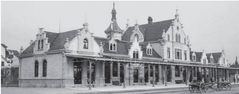
Der Bahnhof Rapperswil um 1905

(sda/rw) Das 1895 von Architekt Karl August Hiller gebaute Bahnhofgebäude in Rapperswil wird umgebaut. Bis Mitte 2008 wird das 1956 angebaute Buffet abgebrochen, sodass die originale historistische Architektur des Bahnhofs wieder sichtbar wird. Im Innern werden Zwischendecken entfernt, die Räume erhalten wieder ihre ursprüngliche Höhe. Die rekonstruierte Haupthalle wird künftig das SBB-Bahnreisezentrum, ein Restaurant und ein Café aufnehmen. Das Perrondach wird erneuert und neu gestaltet. Ursprünglich war ein Abbruch geplant; der Heimatschutz wehrte sich dagegen.