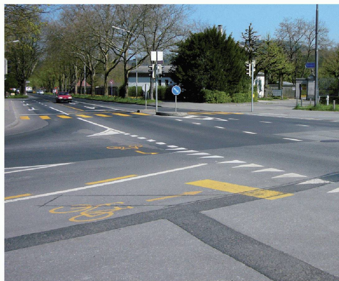
03 Ortsdurchfahrt mit einseitigem Radstreifen in der Steigung (Velokriechspur) und überfahrbarem Mehrzweckstreifen in der Mitte (Überholen Zweiräder, Linksabbiegen)