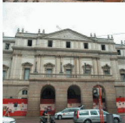
Neubauten in und an bestehenden Bauten

Durch die über 40-jährige Erfahrung und Spezialisierung auf vorbeugende und sanierende Abdichtung gegen drückendes Wasser, sowie ständige Weiterentwicklung der Produkte und Lösungen, können Sie mit RASCOR nur gewinnen.