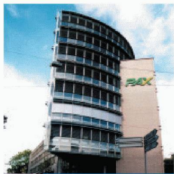
Gewerbe- und Wohnbau