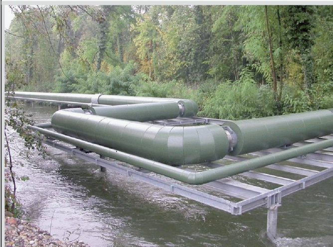
Dampfverbund Solothurn Ost

Wir sorgen für Ihr Wohlbefinden mit Sicherheitslösungen und Gebäudeautomation