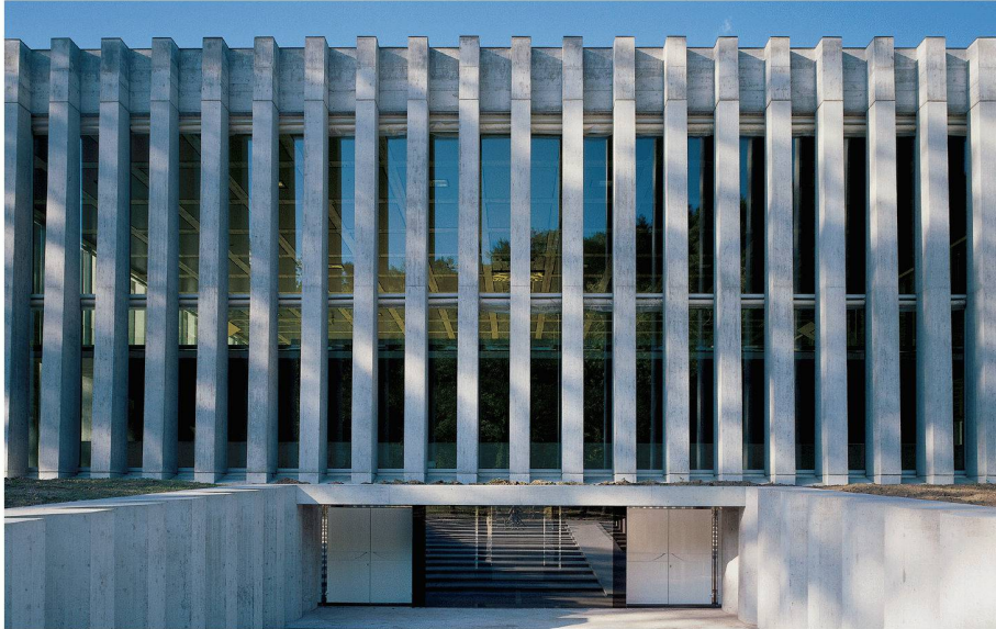
Livio Vacchinis Mehrzweckhalle in Losone