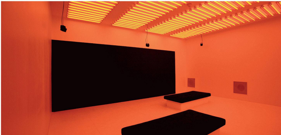
Philippe Rahm: Installation «Diurnisme» der Ausstellung «Airs de Paris», Centre Pompidou

Vor dreissig Jahren begann das Centre Pompidou in Paris seine Ausstellungstätigkeit mit einer Retrospektive zum Werk von Marcel Duchamp. Die nun zu diesem Anlass eingerichtete Schau feiert mit Blick auf das Heute und Morgen das dreissigste Jahr des Bestehens dieses nach wie vor international bedeutenden Orts für die Künste. Wichtigstes Thema sind künstlerische Positionen, mit einbezogen sind Arbeiten zu Architektur, Design und Landschaftsgestaltung.