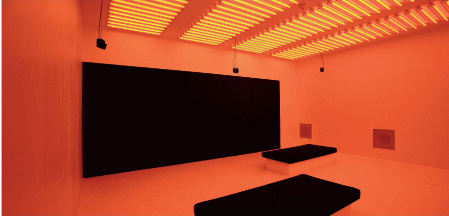
Philippe Rahm: Installation «Diurnisme» der Ausstellung «Airs de Paris», Centre Pompidou

Vor dreissig Jahren begann das Centre Pompidou in Paris seine Ausstellungstätigkeit mit einer Retrospektive zum Werk von Marcel Duchamp. Die nun zu diesem Anlass eingerichtete Schau feiert mit Blick auf das Heute und Morgen das dreissigste Jahr des Bestehens dieses nach wie vor international bedeutenden Orts für die Künste. Wichtigstes Thema sind künstlerische Positionen, mit einbezogen sind Arbeiten zu Architektur, Design und Landschaftsgestaltung.