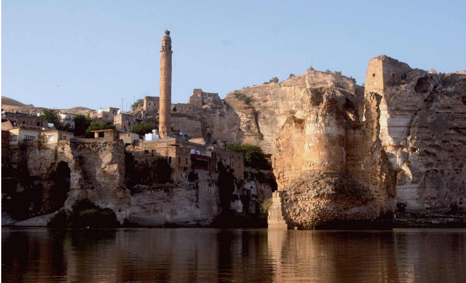
03 Die 11 000 Jahre alte Stadt Hasankeyf würde bis zur Spitze des Minarets überflutet