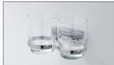
Das neue, noch einmal reduzierte Design der Accessoires-Serie CHIC von Bodenschatz. Jetzt erhältlich!

Wer die Bäder von Mietwohnungen mit CHIC ausstattet, ist auf der sicheren Seite: Die Kombination „günstiger Preis für langlebige und schöne Accessoires“ findet bei der Bauherrschaft ebenso Gefallen wie bei den Mieterinnen und Mietern. Sicherheit verspricht auch die Nachliefergarantie für neue und für bisherige Modelle. Umfassende Informationen zu CHIC sind erhältlich bei der Bodenschatz AG.