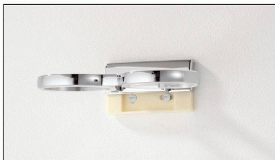
Der Flansch wird an der Wand befestigt, die Accessoires werden ganz einfach darüber geschoben.