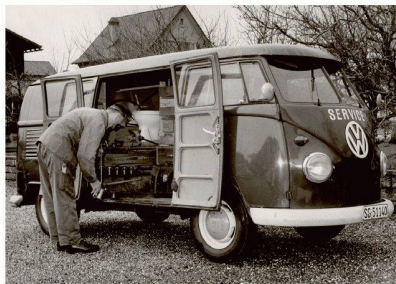
Zeitsprünge: Als dieses Sanitärservice-Auto zum Einsatz kam, war CHIC von Bodenschatz bereits 10-jährig (Bild Schenk-Bruhlin, Sargans 1967)

Im Jahre 1957 revolutionierte die Schweizer Firma Bodenschatz den Markt der Badezimmer-Accessoires auf nachhaltige Art und Weise. Die Produkte ihrer innovativen Accessoires-Serie – der legendären CHIC – waren die ersten, die indirekt – über einen Flansch – an der Wand befestigt wurden. Ein Kunststoffteil wird an der Wand angeschraubt, die Accessoires ganz einfach darüber geschoben. Dank dieser Erfindung waren und sind die Befestigungsschrauben nicht mehr sichtbar und der einmalige Siegeszug durch die Schweizer Badezimmer nahm seinen Lauf.