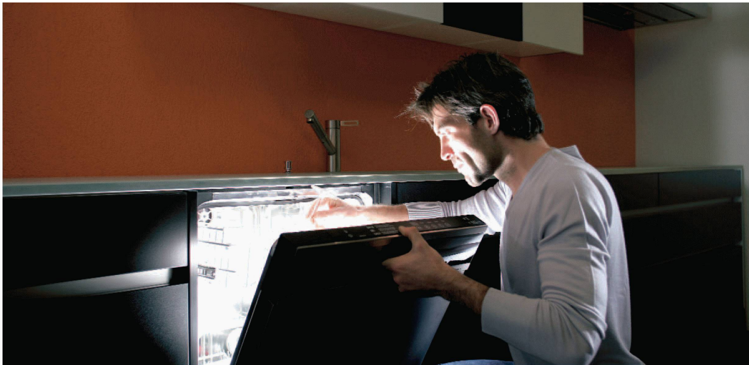
Einfach schön, wenn Teller und Gläser im richtigen Licht erscheinen: Die komfortablen Electrolux-Geschirrspüler machen es möglich.