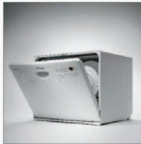
Die kompakte Lösung.