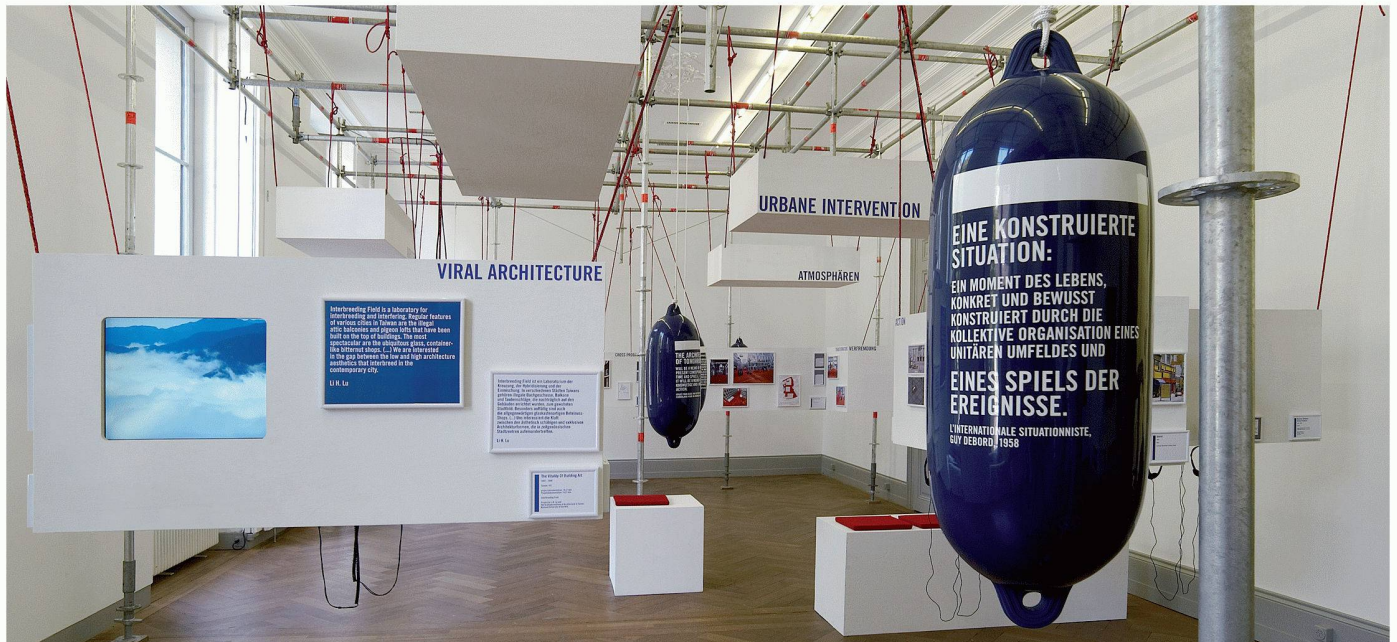
Blick in den ersten Raum des Schweizerischen Architekturmuseums mit Zitaten der Situationisten auf den Schiffsbojen

Die neuste Ausstellung im Schweizerischen Architekturmuseum (SAM) versteht sich als Ergänzung und Erweiterung der derzeit im Museum Tinguely gezeigten Retrospektive der Situationistischen Internationale. Es ist der Versuch, die Forderungen und Ideen der Situationisten der 1960er- und 1970er-Jahre in zeitgenössischen architektonischen und städtischen Eingriffen wiederzufinden.