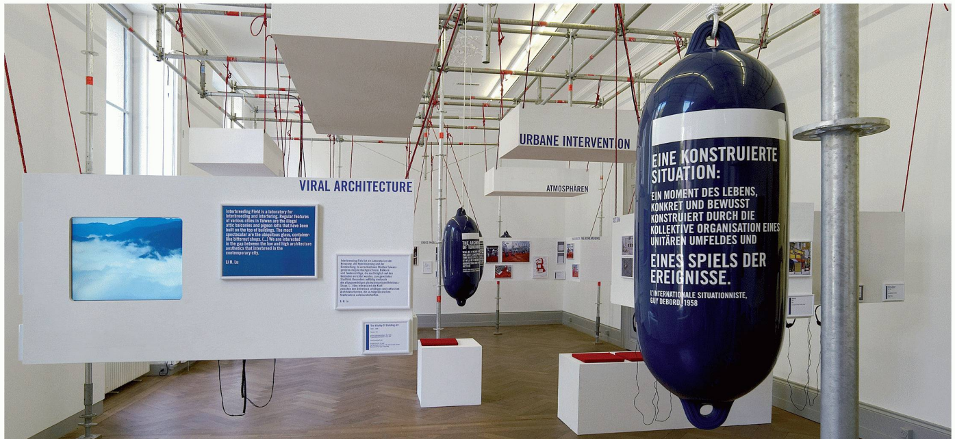
Blick in den ersten Raum des Schweizerischen Architekturmuseums mit Zitaten der Situationisten auf den Schiffsbojen

Die neuste Ausstellung im Schweizerischen Architekturmuseum (SAM) versteht sich als Ergänzung und Erweiterung der derzeit im Museum Tinguely gezeigten Retrospektive der Situationistischen Internationale. Es ist der Versuch, die Forderungen und Ideen der Situationisten der 1960er- und 1970er-Jahre in zeitgenössischen architektonischen und städtischen Eingriffen wiederzufinden.