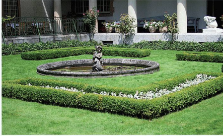
Klassische Elemente einer Parkanlage bei der Villa Langmatt in Baden

(dd) Im Historischen Museum in Baden ist derzeit eine Ausstellung zur Schweizer Gartenkunst im Zeitalter der Industrialisierung zu sehen. In Theodor Fontanes Roman «Effi Briest» spielt der Garten eine entscheidende Rolle. «Fontanes Garten vereint alle realen Funktionen des Villengartens im ausgehenden 19. Jahrhundert», heisst es in der