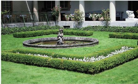
Klassische Elemente einer Parkanlage bei der Villa Langmatt in Baden

(dd) Im Historischen Museum in Baden ist derzeit eine Ausstellung zur Schweizer Gartenkunst im Zeitalter der Industrialisierung zu sehen. In Theodor Fontanes Roman «Effi Briest» spielt der Garten eine entscheidende Rolle. «Fontanes Garten vereint alle realen Funktionen des Villengartens im ausgehenden 19. Jahrhundert», heisst es in der