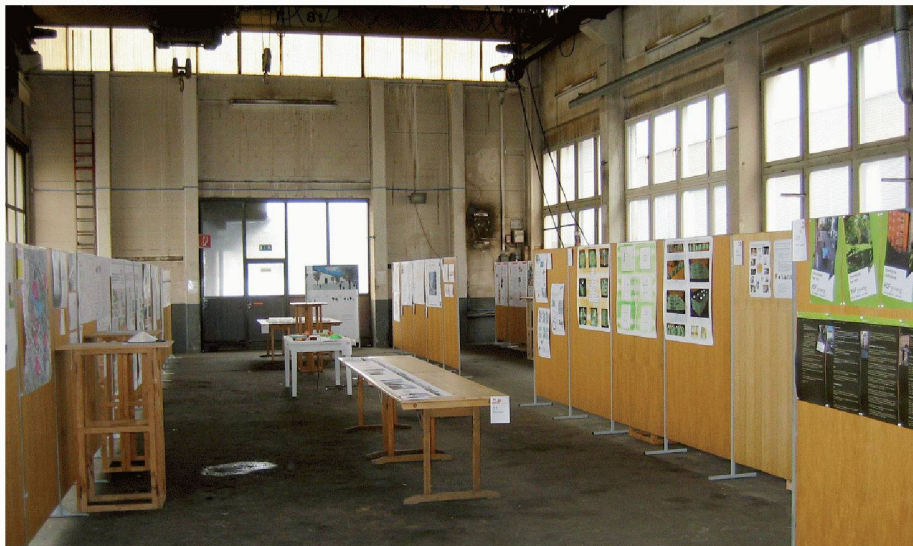
01 «Wie wohnen wir morgen?» Im Werkhallenambiente der Brunner Erben Gruppe in Leutschenbach sind alle 40 Teilnehmerprojekte des gleichnamigen Ideenwettbewerbs ausgestellt

Die Stadt Zürich, vertreten durch das Amt für Hochbauten (AHB), führte im Rahmen des 100-Jahr-Jubiläums für gemeinnützigen Wohnungsbau zusammen mit dem Schweizerischen Verband für Wohnungswesen (SVW), Sektion Zürich, einen offenen Ideenwettbewerb durch. Hierbei wurden zwei Gebiete in zwei grundsätzlich verschiedenen Quartieren der Stadt Zürich als Ausgangslage für die möglichen Beiträge vorgeschlagen: die städtischen Areale im Quartier Leutschenbach und das Gebiet um den Seebahneinschnitt in Zürich Aussersihl. Von den 40 eingereichten Projekten wurden sechs mit je 5000 Franken prämiert und sechs gewürdigt. Unter den prämierten Projekten fiel besonders die Eingabe von Müller Sigrist Architekten durch konkrete Umstrukturierungsvorschläge für Zürich Aussersihl auf. In ihrem Projekt «Pink lady» erhöhen Müller Sigrist die Tiefe der vorhandenen Blockrandbebauung von 10.5 auf 12m, wobei die Innenhöfe selbst von Neben- und Kleinstgebäuden befreit werden. So entstehen grosszügige Aussenräume, die durch punktuelle Öffnungen in den Blockrändern in ein quartierübergreifendes Netz öffentlicher Räume eingebunden werden. Vom Sonntagsmarkt auf der gesperrten Hauptverkehrsstrasse bis hin zum Streichelzoo im Innenhof eines Wohnblocks sind hier verschiedenste Nutzungsmöglichkeiten aufgezeigt. Einher geht hiermit ein verändertes