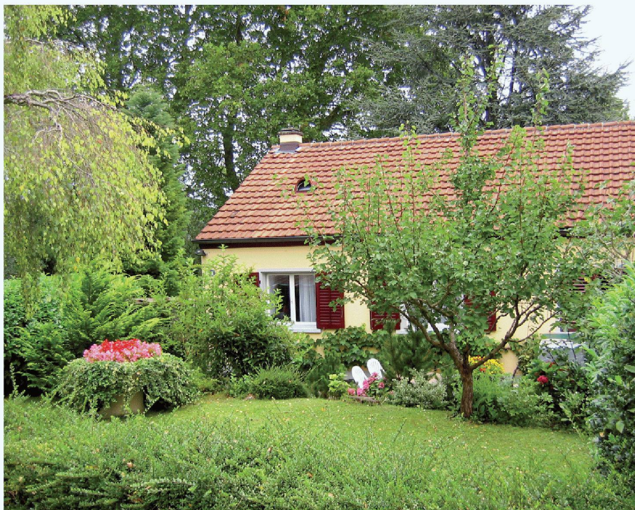
03 Seit 1929 kontinuierlich gewachsene Idylle – in grosszügige Privatgärten eingebettet, wirken die Reihenhäuser am Friesenberg wie Einfamilienhäuser