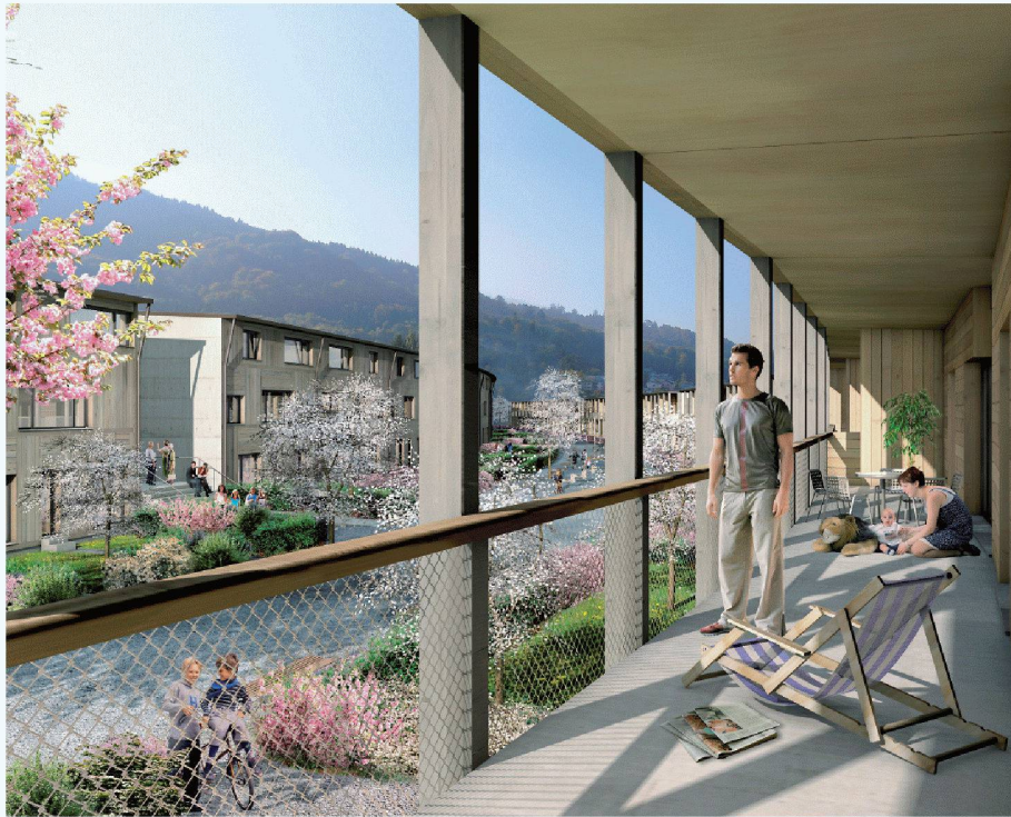
02 Durch die Lage am Hang ist auch bei Mehrgeschossigkeit (2-geschossig zum Tal, 3- bis 4-geschossig zur Hangseite) eine gute Belichtung gegeben (Graber Pulver Architekten, Bern-Zürich / 4d Landschaftsarchitekten)