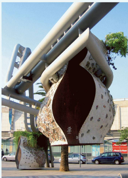
02 Wo Bäume fehlen, da spenden überdimensionale Blumentöpfe Schatten und erinnern an die Gärten von Privathäusern