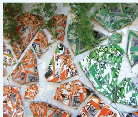
03 Moderne Mosaik à la Gaudí mit Zeitungstext verzieren die schwebenden Blumentöpfe

„ Wir sind in Nürnberg dabei, weil wir auf der Chillventa mit unserer MSR-Technik eine wichtige Rolle spielen. “