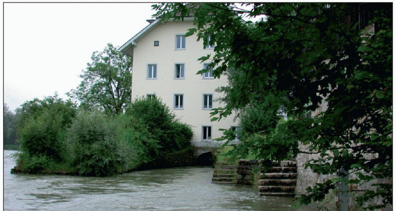
Wieder trocken: Mauerwerk der Gipsmühle in Lauffohr.

«Aquapol» Schweiz bietet ein Sanierungsverfahren an, das völlig ohne Strom, chemische oder mechanische Eingriffe auskommt. Die Gerätetechnologie formt die aufgenommene Erdenergie so um, dass sie den Kräften, die das Wasser in den Mauerporen hochsteigen lässt, entgegenwirkt. Das Wasser fliesst wieder ins Erdreich zurück, und es wird eine grundlegende Trockenlegung und Trockenhaltung des Mauerwerks über lange Zeit erreicht. Die «Aquapol»-Geräte brauchen keinen Stromanschluss und enthalten