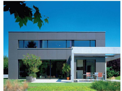
Eternit (Schweiz) AG | Halle 1, Stand A 20 www.eternit.ch

oder Renovationen, die Fassaden- und Dachlösungen von Eternit bestechen durch hohe Funktionssicherheit, Wertbeständigkeit und wirtschaftliche Nutzung über Jahrzehnte. Die äusserst dauerhaften, praktisch unterhaltsfreien Faserzementplatten schützen die Gebäudestruktur zuverlässig vor jeder Witterung. An der Messe erhalten Besucherinnen und Besucher einen Einblick in das breite Spektrum an Gestaltungsmöglichkeiten mit den Eternit-Produkten. Ein besonderes Highlight sind die neuen Fassadenfarbreihen «Nobils», «Planea» und «Terra».