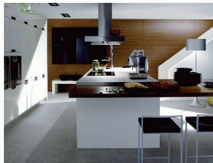
Hans Eisenring AG | Halle 3, Stand C 20 www.eisenring-kuechenbau.ch

ihre individuelle Küchenplanung dreidimensional miterleben. Die Anwendung dieser Technologie steigert die Effizienz und fördert die Kreativität und Spontanität des Kunden während der Planungs- und Beratungsphase. Die effektiven Kosten sind im Vergleich zum Budgetrahmen jederzeit ersichtlich. An der Messe können sich Kunden von Mitarbeitern der Firma Hans Eisenring beraten lassen.