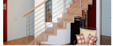
Keller Treppenbau AG | Halle 1, Stand G 02 www.keller-treppen.ch

Ahorn mit Metallsprossen aus mattem Chrom. Des Weiteren ist am Stand eine freitragende Treppe aus geöltem Eichenholz mit Sprossen in einer Holz-Metall-Kombination zu sehen. Wie auch im letzten Jahr zeigt das Unternehmen seine Metall-Holz-Treppe mit Inox-Seilen. Die Stufen sind aus Charme (Hagenbuche), farblos lackiert und versiegelt.