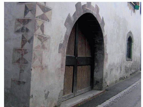
Atheco AG | Halle 2, Stand B 13 www.atheco.ch

Form von Gift- und Konservierungsstoffen zu verzichten. Der Micro-Pore-Entfeuchtungsputz ist hoch wasserdampfdurchlässig und sorgt für eine dauerhafte Abtrocknung von feuchten Mauern. Durch die spezielle Mikroporen- und Kapillarenstruktur verdunstet das im Mauerwerk befindliche Wasser sehr schnell, und gleichzeitig wird der Weitertransport von Wasser in flüssiger Form verhindert. Die Salze gelangen somit nicht an die Oberfläche. Problemwände sowohl im Innen- wie im Aussenbereich können mit diesem Produkt nachhaltig und kostengünstig saniert werden.