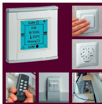
Hager Tehalit | Halle 6, Stand C 16 www.hager-tehalit.ch

Bei Renovationen und Umbauten empfiehlt Hager Tehalit das SL-Sockelleisten-System. Anschlüsse für elektrische Energie, Rundfunk- und Fernsehsignale oder Kommunikations- und Datennetze können mit sehr geringem Montageaufwand installiert werden.