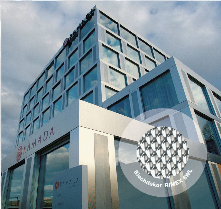
RAMADA Hotel Solothurn

Mit INOX erhalten Sie eine ästhetische, korrosionsbeständige und saubere Oberfläche, die plan ist, nicht verkratzt und leicht zu reinigen ist.