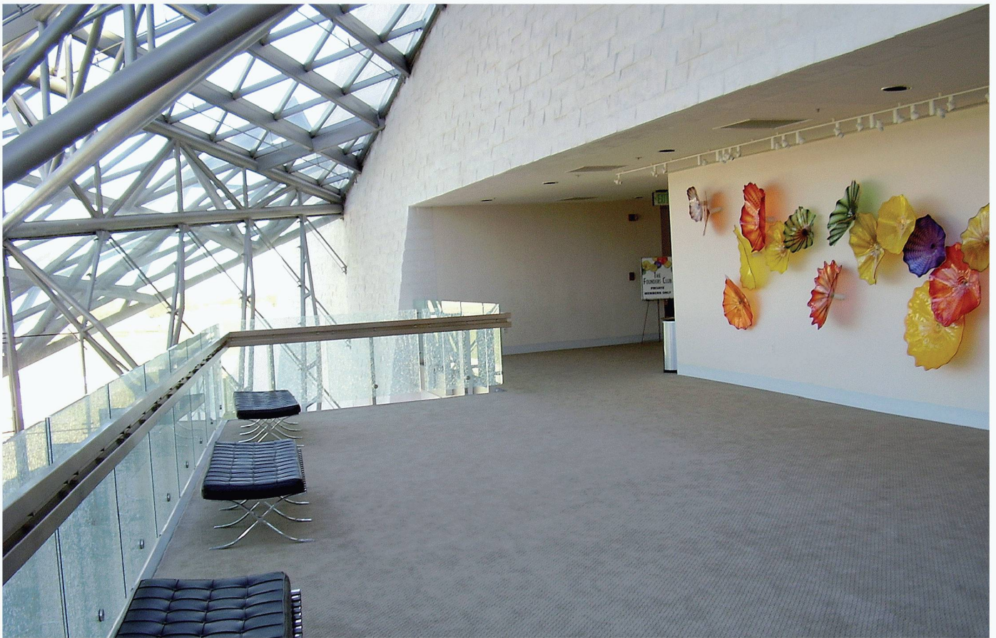
05+06 Spencer Theater for the Performing Arts, 1998, New Mexico