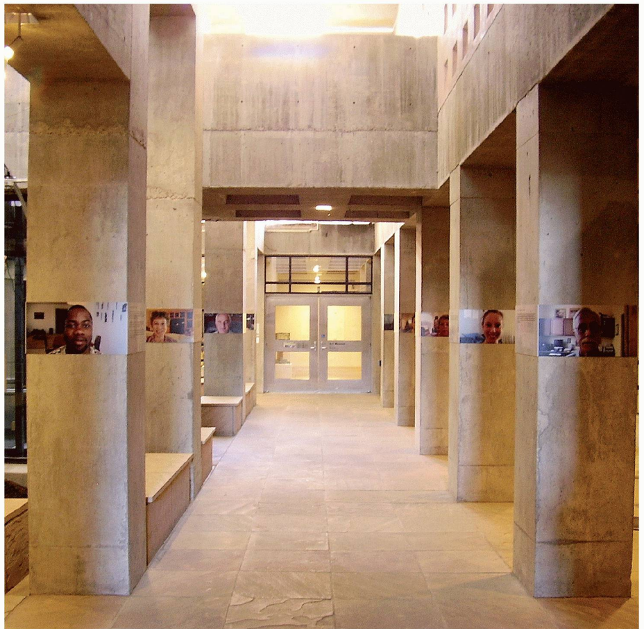
04 Innenansicht des Nelson Fine Arts Museum, 1989, Phoenix, Arizona

Die Ankunft der Spanier in der neuen Welt beruht auf der Legende der Goldenen Städte von Cibola. In der Hoffnung, so reiche indische Städte wie in Südamerika zu finden, führt der Franziskanerpater Marcos de Niza 1539 die erste spanische Expedition in den Südwesten (New Mexico). Eine Vorhut berichtete von sagenhaften Reichtümern im Land der Zuni. Marcos glaubte, das sagenhafte Land Cibola gefunden zu haben – der Mythos war geboren und hielt sich hartnäckig. Da es kein Gold gab, verloren die Spanier vorübergehend ihr Interesse, bis Juan de Onate 1598 die Kolonie New Mexico gründete (das heutige New Mexico, Arizona, Nevada, Utah, Colorado, Texas und Kalifornien). Dominic Marti