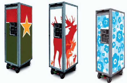
bordbar | D-50933 Köln www.bordbar.de

sen aufbewahrte, kann für Kleinigkeiten wie Schlüssel, Telefon oder im Büro für Briefumschläge verwendet werden. Zum Öffnen der Tür wird der Hebel nach oben geschoben (open – close). Sie lässt sich um 270° drehen und liegt somit an der Aussenseite an. Ein Magnet sichert die Tür. Im Inneren befinden sich 27 Führungen für Schubkästen und Regalböden. Sie garantieren eine flexible Inneneinteilung. Für den sicheren Stand sorgt eine Fussbremse. «Bordbar» bietet eine Vielzahl an Mustern an. Diese werden als digital bedruckte Folie aufgetragen und können auf der Website ausgewählt werden.